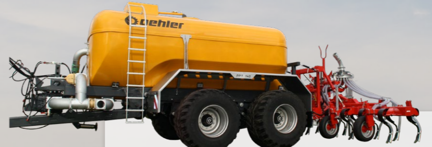
evers Solutions that work! PPT 165 GFK 16.500 Liter Tandem-Pumptankwagen mit Grubber