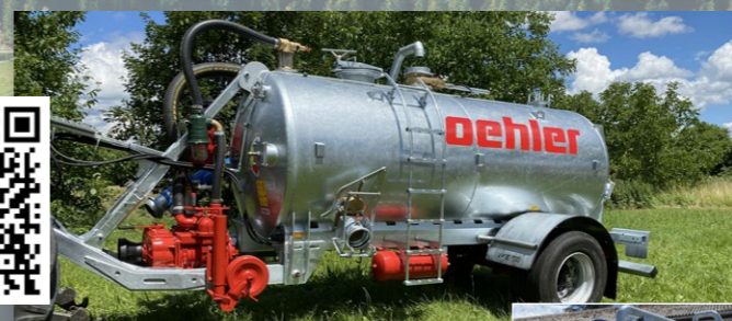
VKE 60 Einachs-Vakuumentankwagen • Mit Gardasystem und Schlauchhaspel zur Bewässerung • 6.000 Liter Einachs Vakuumentank • Innen- und außen feuerverzinkt • 30 mtr. Schlauchrolle/ Hydrantenanschluss