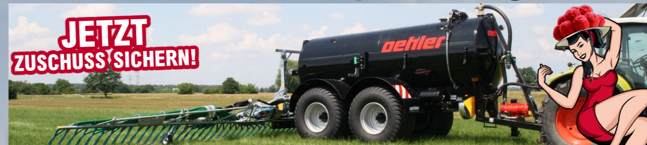
VKT 140 14.000 Liter Tandem-Vakuumentankwagen mit 15 mtr. Schleppschuhverteilung