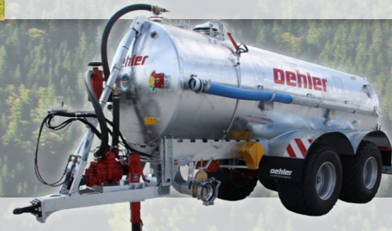
VKT 165 Tandem-Pumptankwagen • Hochleistungskompressor mit automatischer Saug- und Druckschmierung • 16.500 l Qualitätsstahlbehälter • selbsttragende, fest verschweißter Rahmenkonstruktion, • innen- und außen feuerverzinkt