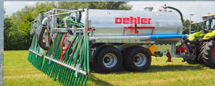
VOGELSANG VKT 120 12.000 Liter Tandem-Vakuumentankwagen mit Schleppschlauchverteilung