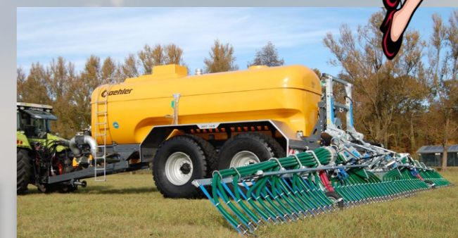
BOMECH Quality by Experience PPT 185 GFK 18.500 Liter Tandem-Pumptankwagen mit 15 mtr. Schleppschuh