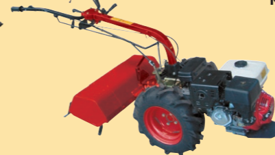
OL 170 Bodenfräse