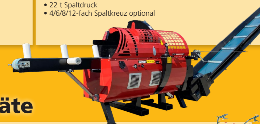
OL 4800 HZ • 450mm Schnittdurchmesser • 22 t Spaltdruck • 4/6/8/12-fach Spaltkreuz optional