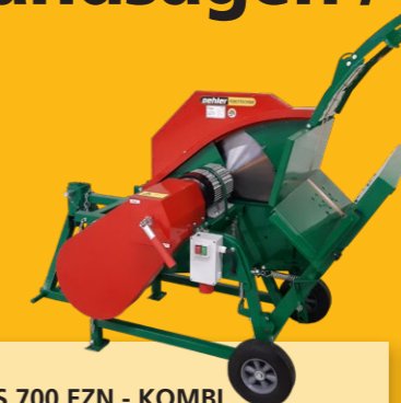
OL WS 700 EZN - KOMBI • Kombiniert Zapfwellenantrieb + E-Motor 400 Volt / Keilriemenantrieb • ø700mm Kreissägeblatt