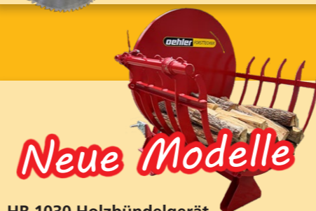
HB 1030 Holzbündelgerät • für Scheitholz i. d. Längen 30, 50 und 100 cm • Bequeme Beschickung und einfaches Auskippen • Anhängung an Dreipunkt • optional mit 4-Punkt / hydr. Kippung

NEU: 64 Zähne für ruhigen Lauf Hartmetallblatt gratis eingebaut