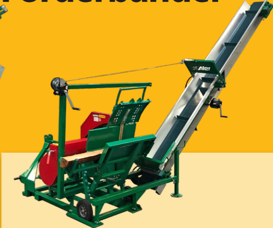
OL WS 700 ZN mit Förderband OL FO 400 A • Zapfwellenantrieb / Keilriemenantrieb • ø700mm Kreissägeblatt