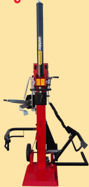
OL 1114 12t Spaltdruck • Elektroantrieb 400 V

OL 1140 / 1190 Holzspalter mit 14t / 19t Spaltdruck • Zapfwellenanschluß