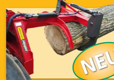
OL HZ2350 Hydraulische Rückezange • 3-Punkt Aufhängung • Max Öffnungsweite 2300mm • Gewicht 325 kg • Schließkraft 6 t • Arbeitsdruck 120 Bar