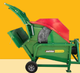
OL WS 700 ZN • Zapfwellenantrieb / Keilriemenantrieb • ø700mm Kreissägeblatt