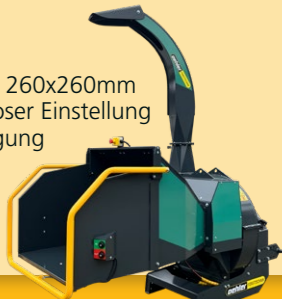
OL 2620 SH • 3-Punkt Anbau • max. Einzugsöffnung 260x260mm • 4 Messer mit stufenloser Einstellung • inkl. eigene Ölversorgung