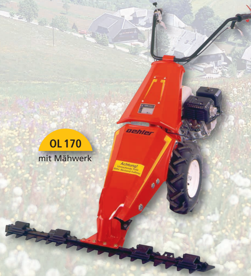
OL 170 mit Mähwerk

Unser Favorit mit sparsamen umweltfreundlichen 4-Takt-Benzin-Motoren und der lukrative Preis ermöglicht Ihnen den Kauf zu einem preisgünstigen Gartenhelfer, für das ganze Jahr einsetzbar.