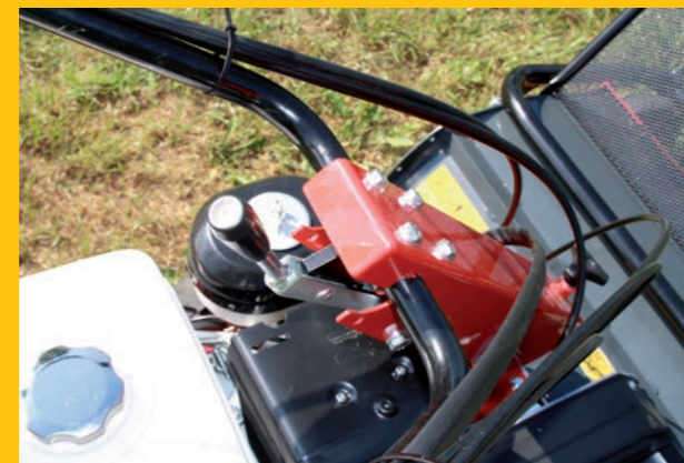
Führungsholm seiten- und höhenverstellbar