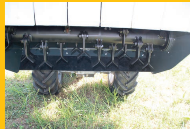
Robustes, langlebiges Schneidwerk mit Y-Messer