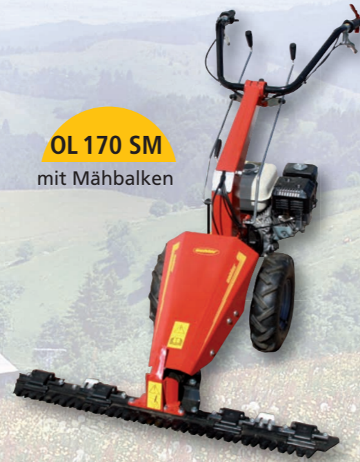
OL 170 SM mit Mähbalken