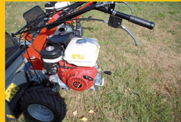
Besonders wartungsfreundlich durch bewährte Honda GX Motoren