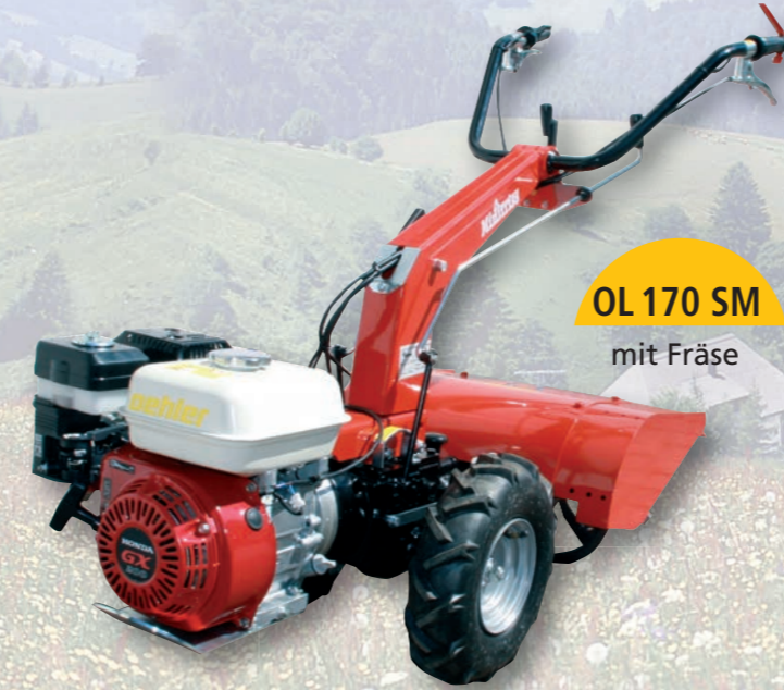
OL 170 SM mit Fräse