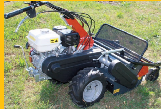
Schnitt Höheneinstellung und Steinschlagschutz