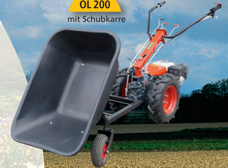
OL 200 mit Schubkarre